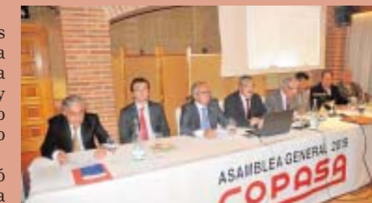
Asamblea General de COPASA en 2015.

Manteniendo eso sí, como en los inicios la vocación de servicio, la orientación al socio, la calidad, la transparencia y la honradez como principios fundamentales del cooperativismo.