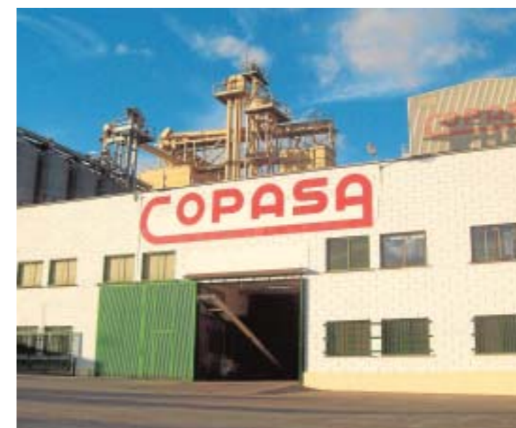
Exterior de las instalaciones de COPASA.