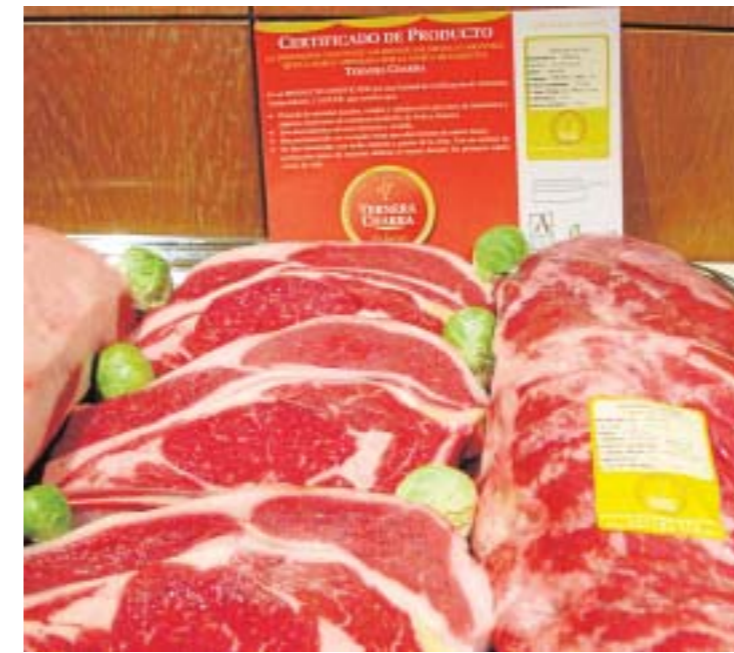
Nuestro producto, carne de vacuno Ternera Charra.

Hoy COPASA cuenta con 800 socios activos , todos ellos ganaderos, y basa su actividad en la producción de pienso de calidad para las explotaciones