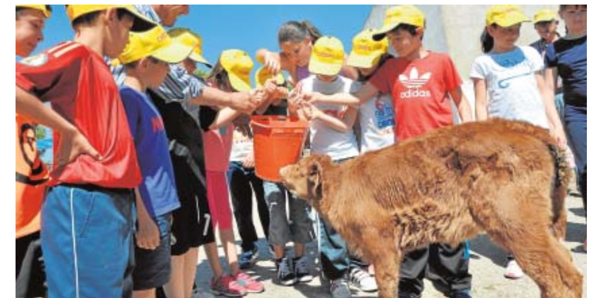
Jornada escolar en Trabadillo, Mayo-2015.