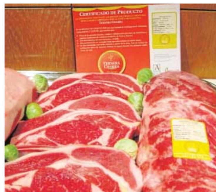
Nuestro producto, carne de vacuno Ternera Charra.

Hoy COPASA cuenta con 800 socios activos , todos ellos ganaderos, y basa su actividad en la producción de pienso de calidad para las explotaciones