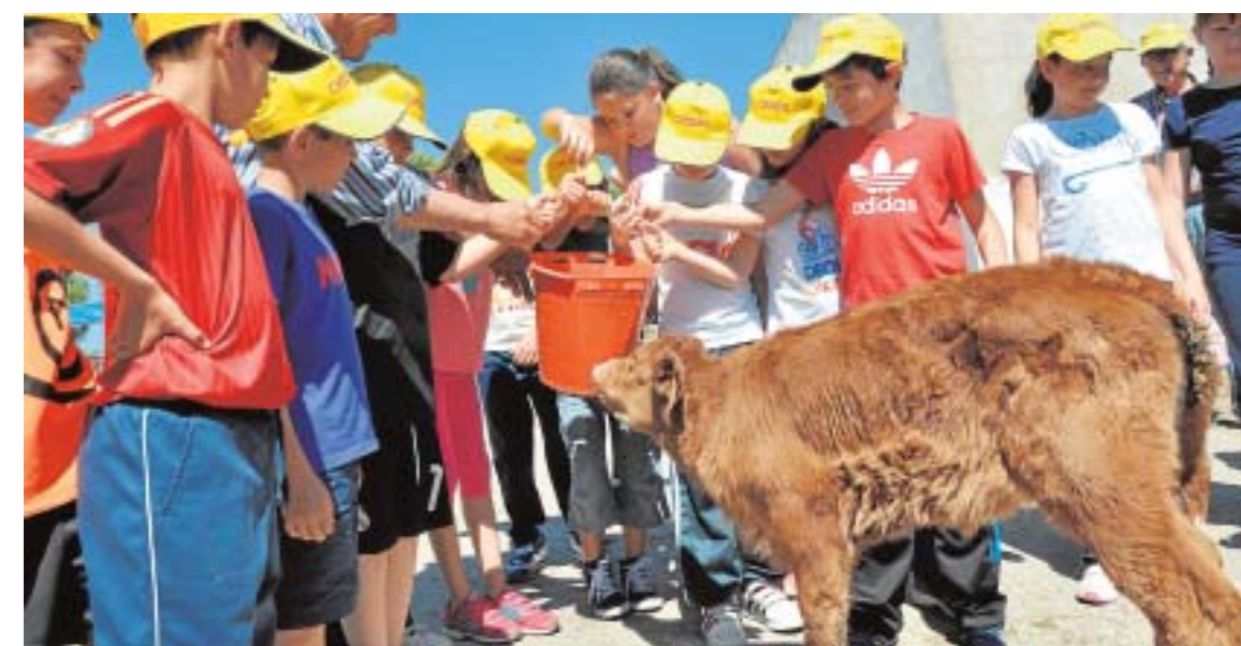
Jornada escolar en Trabadillo, Mayo-2015.