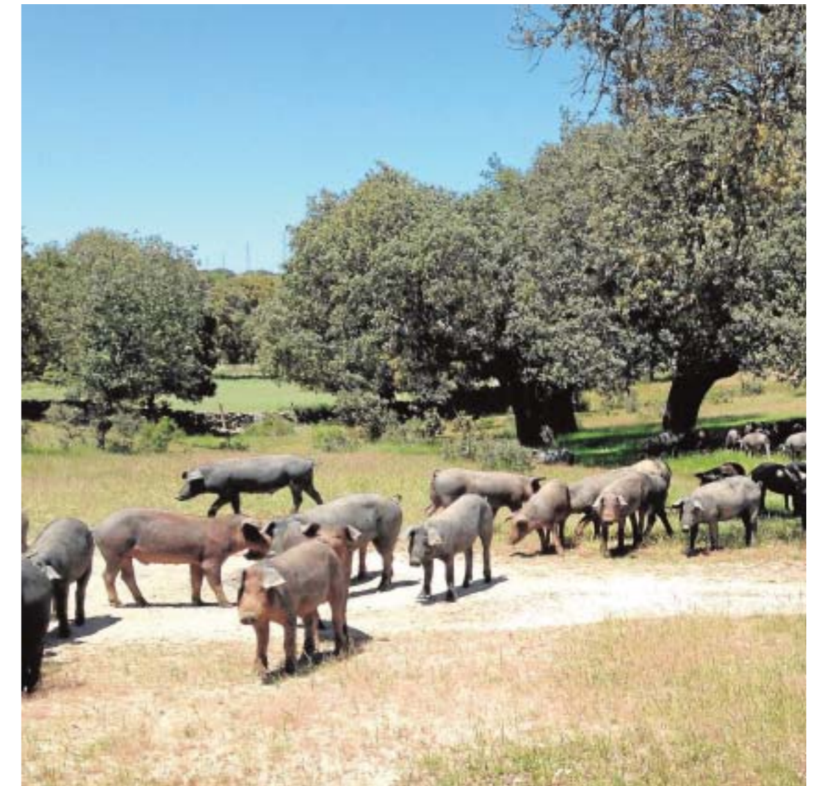
Alimentamos a los cerdos ibéricos desde hace más de treinta años.

Además colabora con publicaciones técnicas de nutrición y producción animal tanto de Castilla y León (Revista UR-CACYL) como nacionales (NUTRINEWS) y promociona el sistema cooperativo y la producción agrícola y ganadera acercándolos a la infancia, colaborando con LA GACETA REGIONAL de Salamanca en la organización y patrocinio de los concursos de dibujo infantil "La naturaleza y el campo fuentes de vida" y fotografía "Así somos en mi pueblo", y organizando visitas de los colegios de Educación Primaria tanto a fincas agrícolas y ganaderas como a las propias instalaciones de la cooperativa y al Mercado de Ganados de Salamanca.