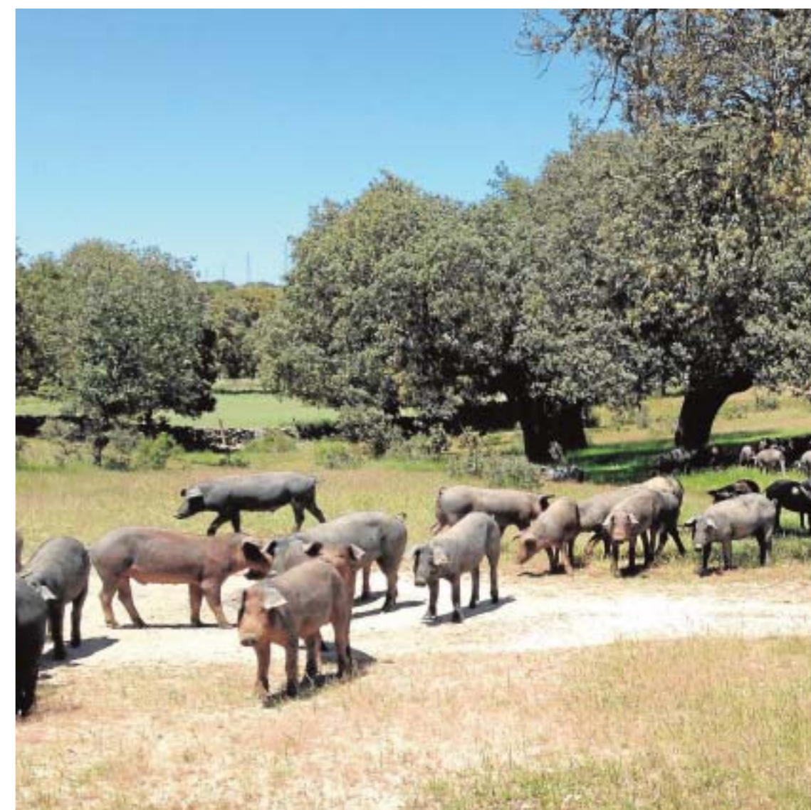
Alimentamos a los cerdos ibéricos desde hace más de treinta años.

Además colabora con publicaciones técnicas de nutrición y producción animal tanto de Castilla y León (Revista UR-CACYL) como nacionales (NUTRINEWS) y promociona el sistema cooperativo y la producción agrícola y ganadera acercándolos a la infancia, colaborando con LA GACETA REGIONAL de Salamanca en la organización y patrocinio de los concursos de dibujo infantil "La naturaleza y el campo fuentes de vida" y fotografía "Así somos en mi pueblo", y organizando visitas de los colegios de Educación Primaria tanto a fincas agrícolas y ganaderas como a las propias instalaciones de la cooperativa y al Mercado de Ganados de Salamanca.