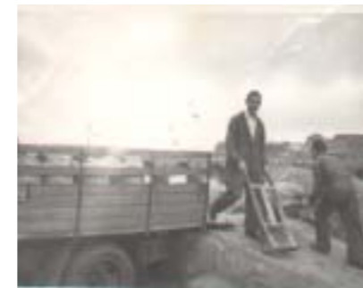
Trabajadores transportando cereal. Fotografía de 1963.