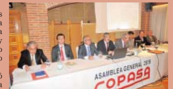
Asamblea General de COPASA en 2015.

Manteniendo eso sí, como en los inicios la vocación de servicio, la orientación al socio, la calidad, la transparencia y la honradez como principios fundamentales del cooperativismo.