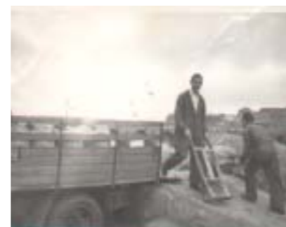
Trabajadores transportando cereal. Fotografía de 1963.