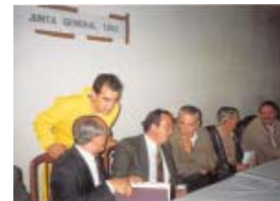
Un momento de la Asamblea General de COPASA en 1992.

mo Gerente, volcado en la atención total al socio, COPASA alcanzó un desarrollo comercial y técnico muy notable, centrando su actividad en la producción de piensos para vacuno de carne y porcino ibérico, dotándose de servicio veterinario y suministro de zoosanitarios. Este incremento del volumen de producción generó la necesidad de una nueva reforma integral de la fá-