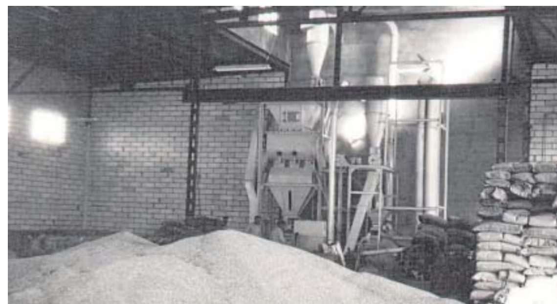
Primera instalación de fábrica 1970.