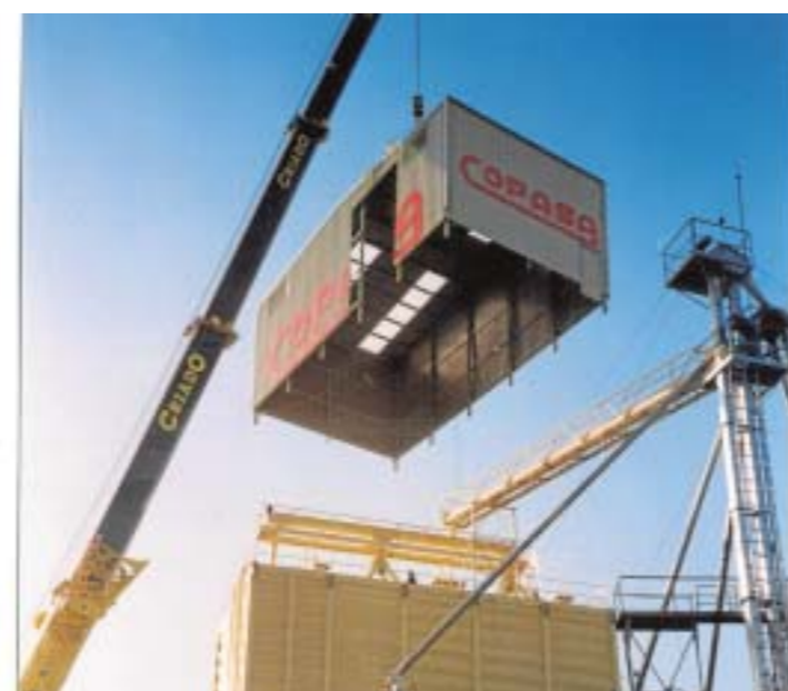
Colocando la nueva torre de fabricación. Año 2002.