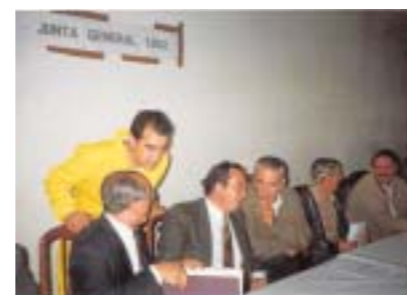
Un momento de la Asamblea General de COPASA en 1992.

mo Gerente, volcado en la atención total al socio, COPASA alcanzó un desarrollo comercial y técnico muy notable, centrando su actividad en la producción de piensos para vacuno de carne y porcino ibérico, dotándose de servicio veterinario y suministro de zoosanitarios. Este incremento del volumen de producción generó la necesidad de una nueva reforma integral de la fá-